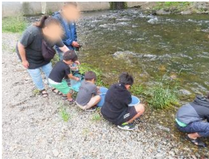
稚アユの放流体験の様子