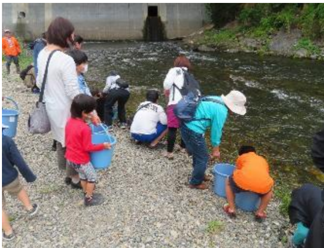
稚アユの放流体験の様子