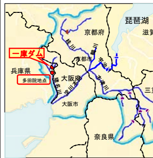
一庫ダムと多田院地点の位置図