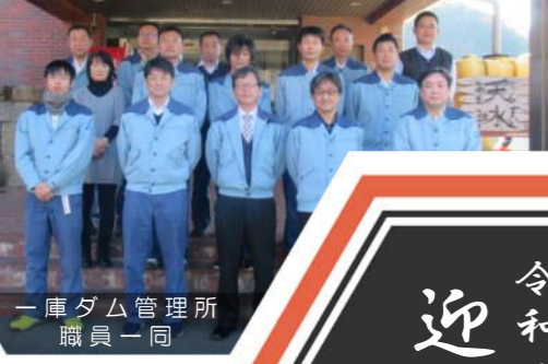
一庫ダム管理所 職員一同