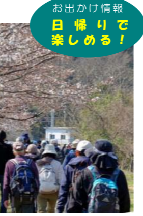
お出かけ情報 日帰りでも楽しめる!

能勢電鉄が主催する「のせでんハイキング」では、ハイキングスタッフが同行しますので、初めての方でも安心してハイキングを楽しむことができます。