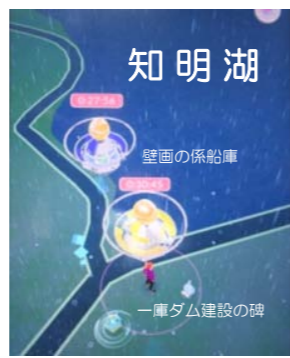
職員のスマートフォン ポケモンGO画面より

「一庫ダム建設の碑」と「壁画が描かれた係船庫」はポケモンGOのジムになっています。また、周辺にはポケストップもあり、ポケモンGOには絶好の場所。休日にはハイキング、サイクリングしながらポケモンGOを楽しんでみてはいかがでしょうか?