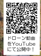
ドローン動画をYouTubeにて公開中！