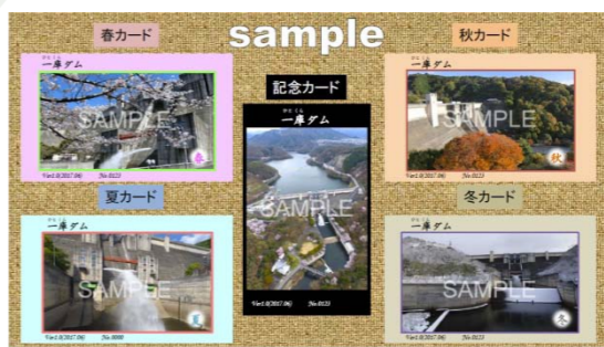
職員によるデザイン、手づくりのダムカードです。この他にも施設見学やイベントなど、その時にしか手に入らないダムカードも!?

プライベートダムカードは3ヶ月毎に写真が異なり、一年を通じた全種類のプライベートダムカード(計4枚)をコンプリートするとさらに特別なダムカードをお渡しいたします。是非足を運んでいただき、特別なダムカードGETに挑戦してみてください。