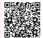
ドローン動画を YouTubeにて公開中!