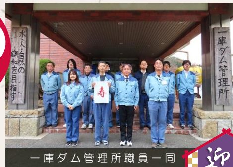
一庫ダム管理所職員一同

さて、「コロナ禍も続いている中ですが、一庫ダムでは感染対策を取りながら地域交流やイベントなどの活動を徐々に再開・拡大しています。今年は管理開始40年の節目の年であり、それを記念した取り組みも進めて参ります。これらに対しましても、ご理解とご協力をお願い申し上げます。