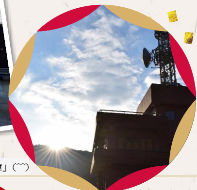
一庫ダムを照らす「ダイヤモンド一庫」(〇〇)