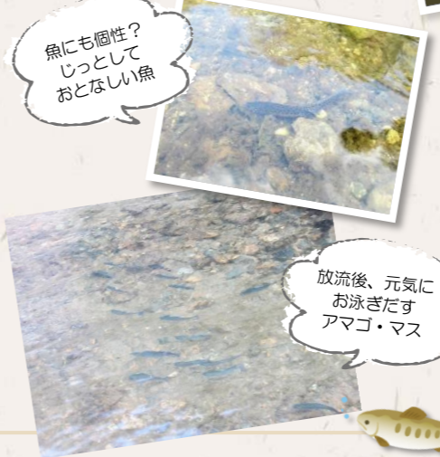
魚にも個性？じっとしておとなしい魚

アマゴ・マス釣り大会前日には、猪名川漁業協同組合によるアマゴ・マス放流が行われ、一庫ダムからも職員数名がお手伝いしました。放流してすぐさま逃げていくアマゴ・マスもいれば、そのままじっとして動かなくなる子もいて、魚にも個性があるのでは？と感じました。