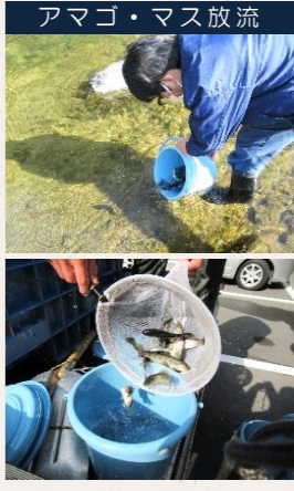
アマゴ・マス放流

アマゴ・マス釣り大会前日には、猪名川漁業協同組合によるアマゴ・マス放流が行われ、一庫ダムからも職員数名がお手伝いしました。放流してすぐさま逃げていくアマゴ・マスもいれば、そのままじっとして動かなくなる子もいて、魚にも個性があるのでは？と感じました。