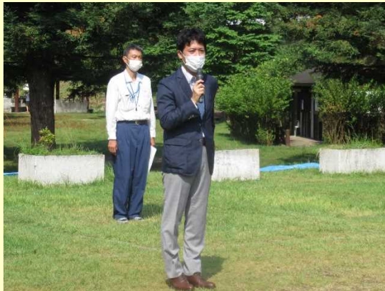
越田謙治郎 川西市長