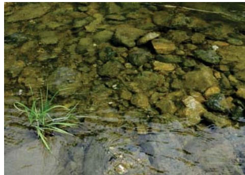
フラッシュ放流後(古い藻の剥離)