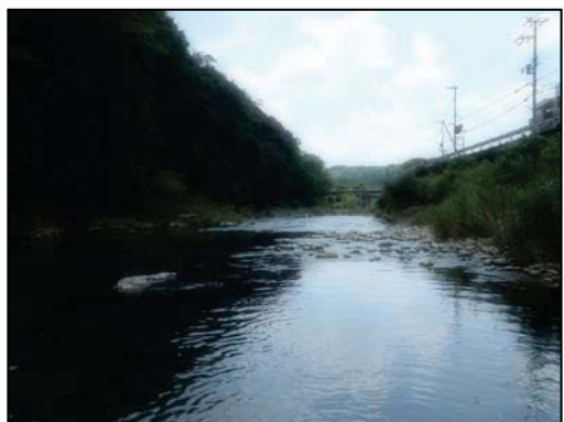
④平成 27 年 現在の様子