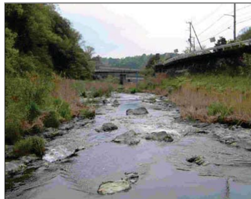
②平成 14 年の河床が露出した状況