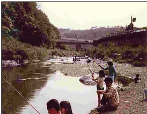
①昭和 57 年 (建設当時) のダム下流部の様子