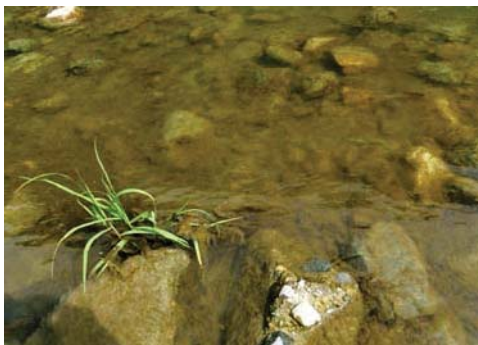
フラッシュ放流前(古い藻の付着)