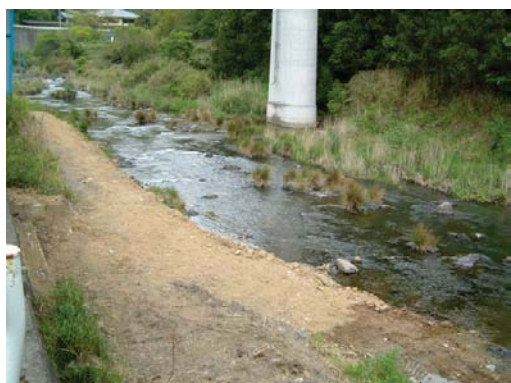
③平成 14 年に土砂を供給した直後