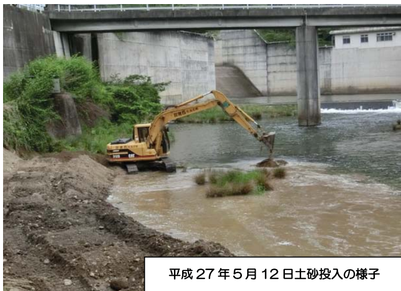
平成27年5月12日土砂投入の様子

土砂還元フラッシュ放流は、ダム直下流に土砂を直接投入し、放流量を増やして流下させ、河川に土砂を還元させます。これにより石などに付着した長く伸びた藻類をはがして、新たな藻類の成長を促進するとともに、土砂供給による底生動物や魚類等の生息環境を作り出すために行います。