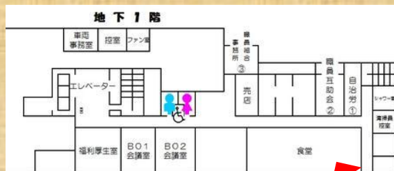
川西市役所地下 食堂