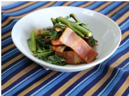
空心菜とベーコン の炒め物