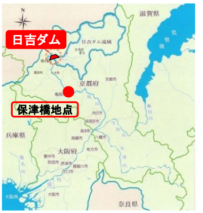
日吉ダムと保津橋地点の位置図