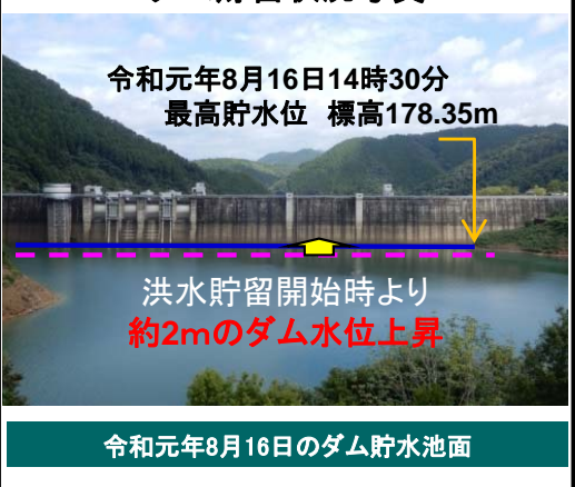
ダム貯留状況写真