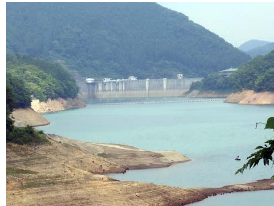
6月16日の日吉ダム貯水池状況(イメージ)