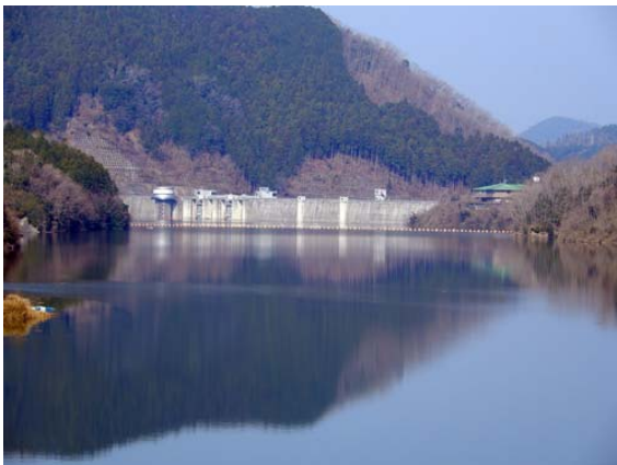
3月27日の日吉ダム貯水池状況