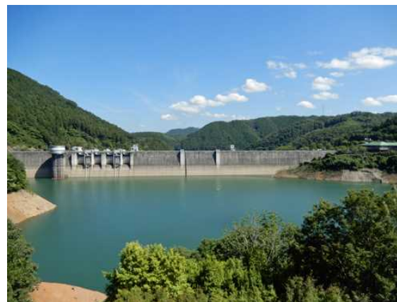
6月16日の日吉ダム貯水池状況(イメージ)