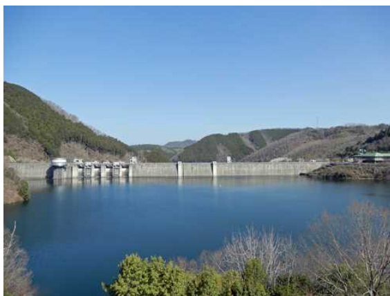
3月31日の日吉ダム貯水池状況