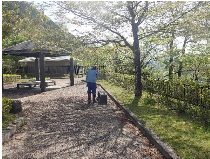
管理所周辺部分の点検状況

施設を利用するにあたり危険等の可能性が確認された箇所については、速やかに改善等の措置を実施して参ります。