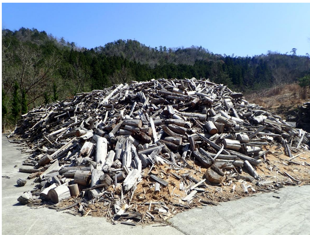
流木(小)の仮置き状況