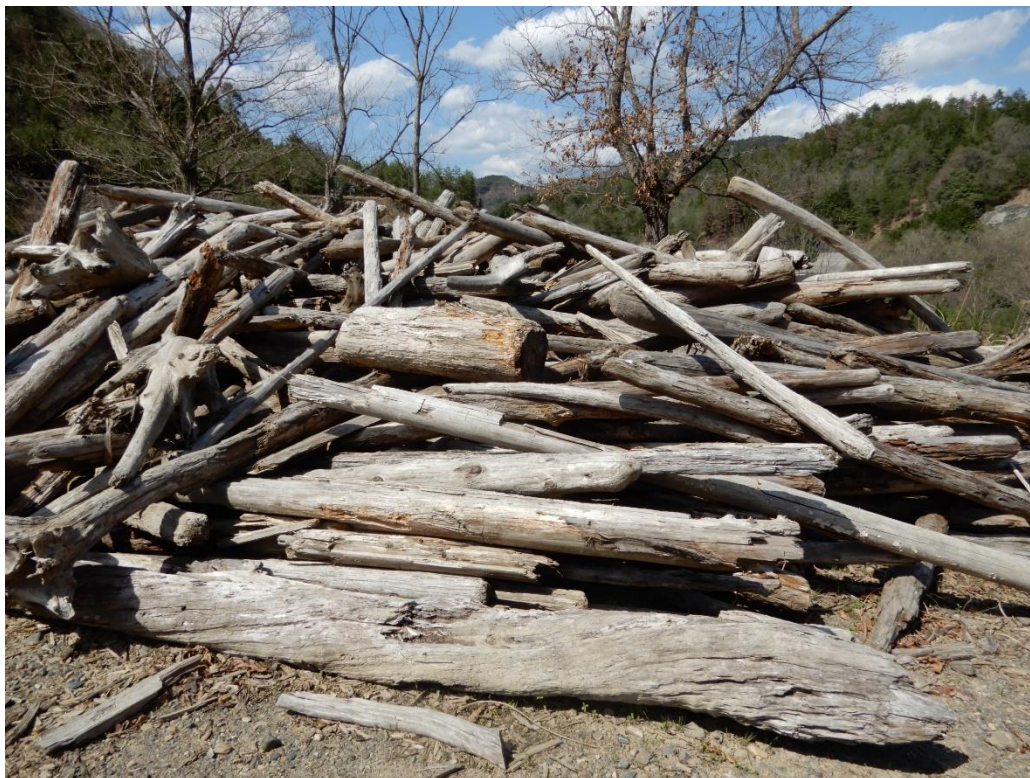
流木(大)の仮置き状況