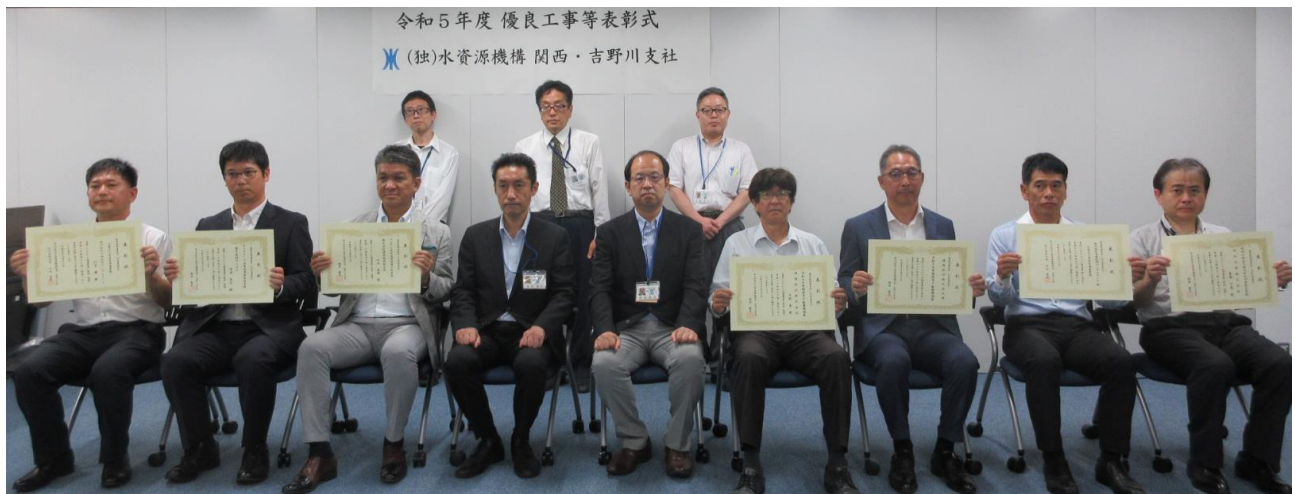
【優良業務表彰 受賞者】