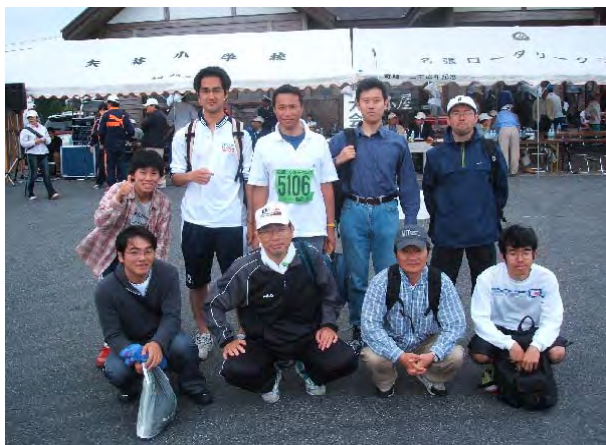
川上ダムのメンバー

5月29日（日）、青山高原にて「第18回青山高原つつじクォーターマラソン大会」が開催され、県内外から参加した約1000人が高低差100mの険しいコースを駆け抜けました。その中で、わが川上ダムチームは、3km部門に2人、5km部門に6人の計8人が参加しました。