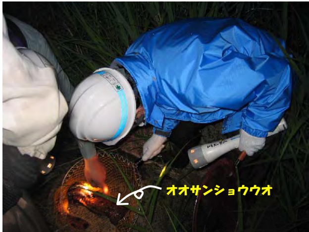
唯一発見できたオオサンショウウオ

の生態に触れることができ、また見たことがなかったホタルを発見でき、貴重な体験をさせていただきました。【通信記者・田中幸志】