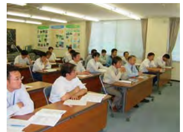
話に聞き入る職員一同