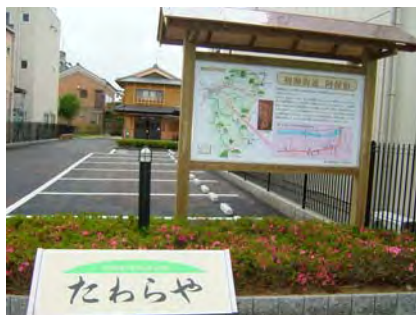
観光看板と「たわらや」(後方)

青山観光協会がこのほど、初瀬街道（はせかいどう）沿いの伊賀市阿保の旧阿保宿に観光看板を設置しました。