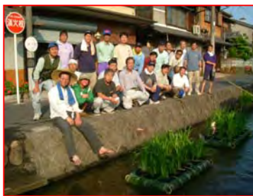
完成した「花いかだ」と参加者のみなさん