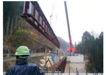
桁架設状況 (H19. 12. 21 撮影)