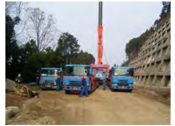
大型クレーン組み立て状況 (H19. 12. 21 撮影)