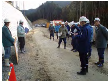
安全パトロールの様子