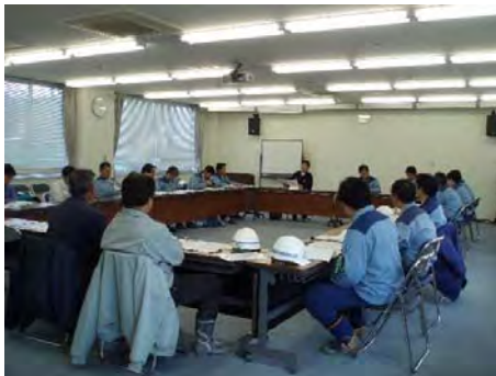
安全協議会の様子