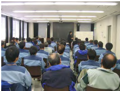
人権問題研修会の様子

平成 19 年 12 月 19 日（水）、木津川ダム総合管理所と合同で人権問題研修会・安全運転講習会を開催しました（於：同総合管理所）。