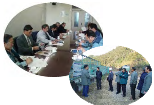
事業説明及び保護池視察の様子