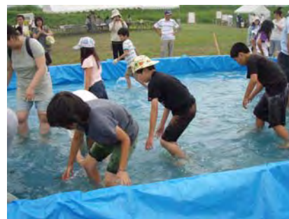
アユのつかみ取り

当日は、雨が降りそうな天気でしたが、約350人の親子連れの方々が募り、子供達は、設置された生け簀に入り、服が濡れることも気にせず、逃げ回るアユを捕まえては歓声を上げ喜んでいました。