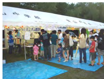
川上ダムブースの様子