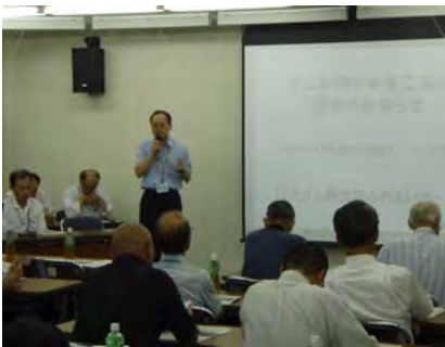
ー上下流地区説明会ー