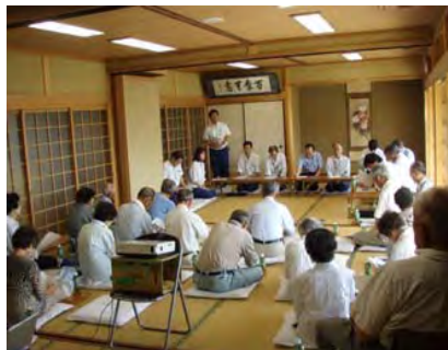
ー川上地区説明会ー