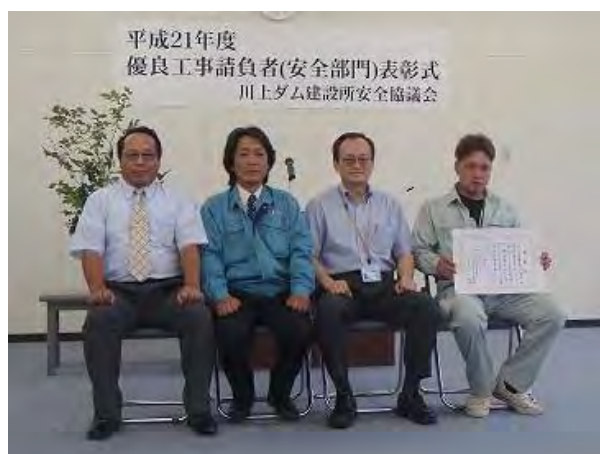
受賞された「坂口・水谷経常建設共同企業体」