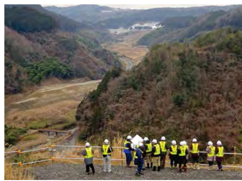
ダムサイト右岸天端にて