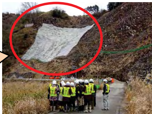
西之沢橋付近にて