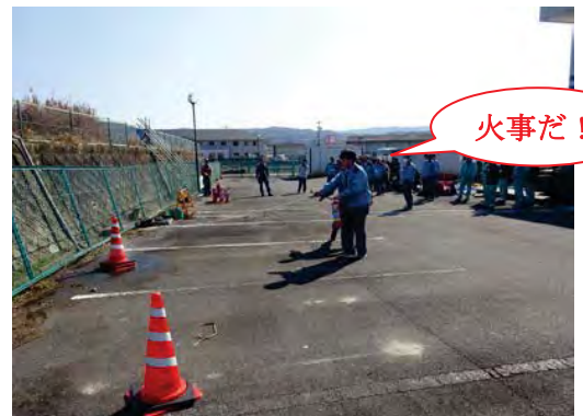
実際に消火器を用いた訓練

当建設所では、いざという場合は迅速に、そして確実な行動がとれるように引き続き訓練を重ね、職員の防災意識と対処能力の向上に努めてまいります。【第二用地課 八重樫知宏】