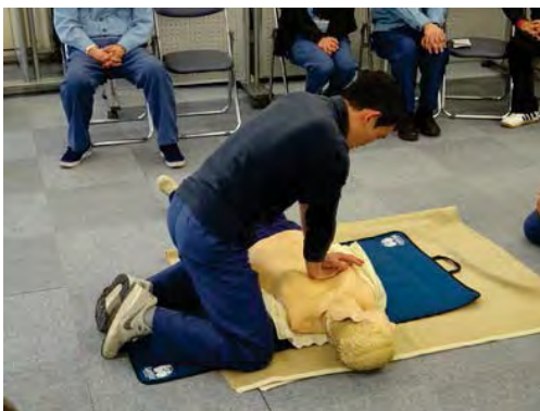
押す場所やペース、力加減が大切です

消防署の方からは「早めの通報」「早めの消火」「早めの避難」が人命を救い、被害を最小限に食い止めるために重要であるとお話があり、万が一の際には何事にも早めの行動を取る必要性を認識いたしました。