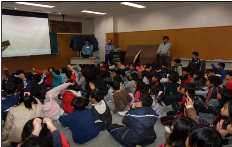
室内での説明状況(青山小学校) 平成23年2月撮影