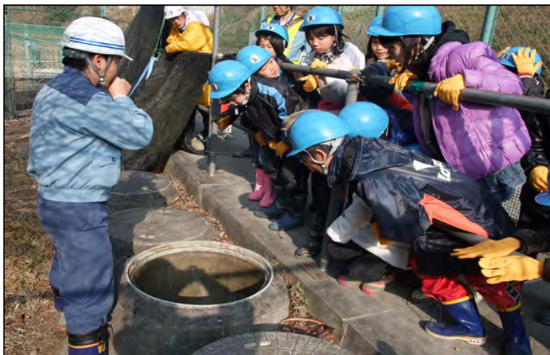
オオサンショウウオの観察状況 平成23年2月撮影