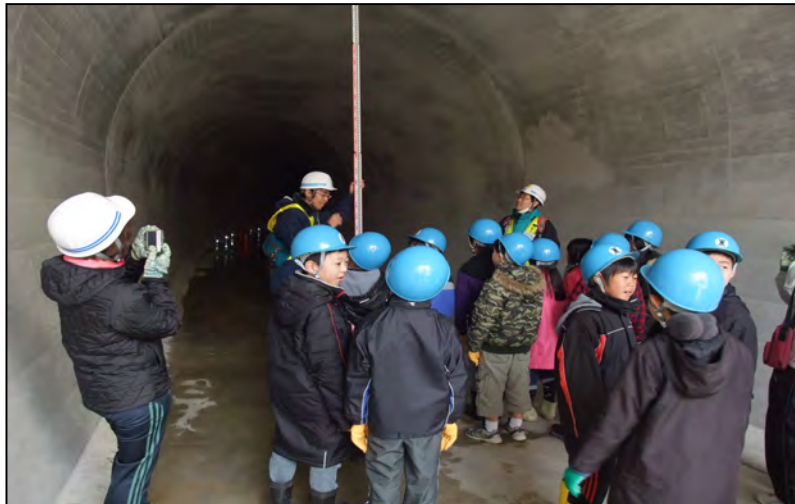
仮排水路トンネル見学状況 平成23年2月撮影