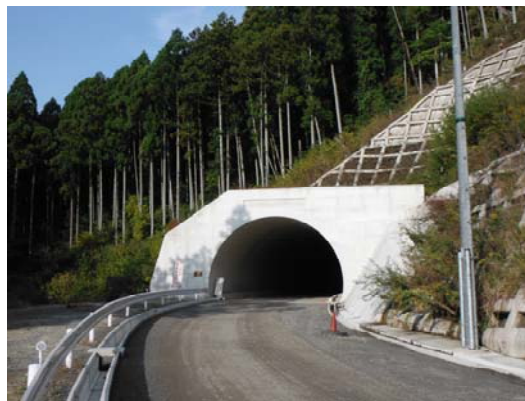
北野トンネル（H24.5完成）