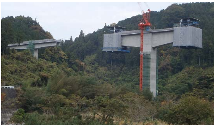
猫また大橋（工事中：H24.11.9現在）