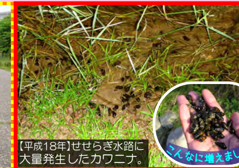
【平成18年】せせらぎ水路に大量発生したカワニナ。