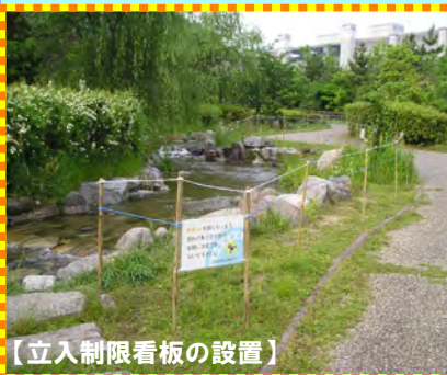
【立入制限看板の設置】