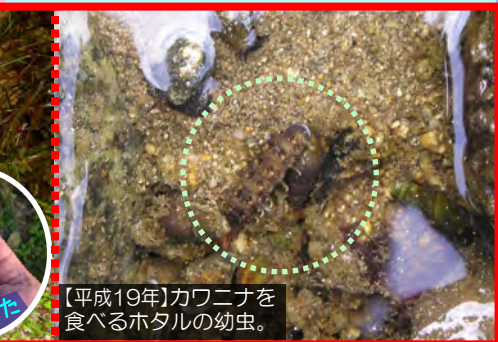
【平成19年】カワニナを食べるホタルの幼虫。