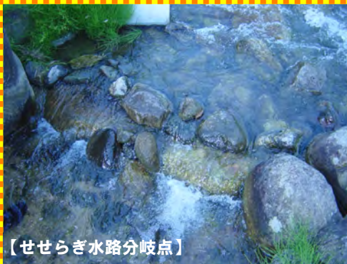
【せせらぎ水路分岐点】

①平成13年「花瀬川」からホタルの幼虫の餌となるカワニナを採取し、“せせらぎ水路”へ放流。カワニナの育生状況と、ホタルの観察を開始。