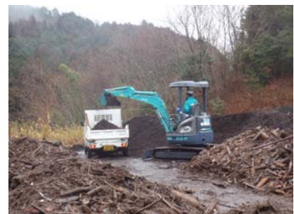
細かく砕いてチップ化