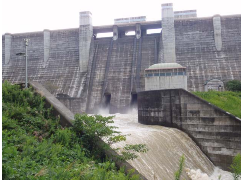
常用洪水吐きからの放流