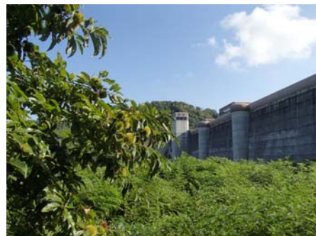
ダム左岸のヤマグリ