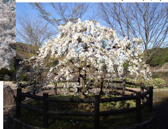
やなひろ文化財公園の シダレザクラ