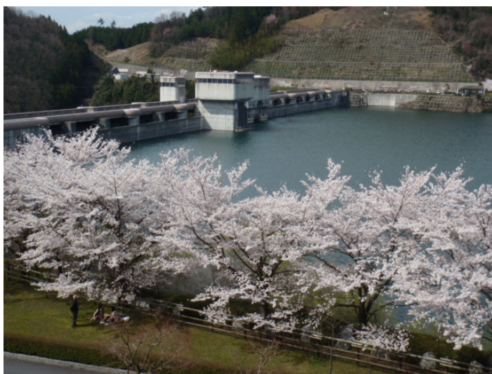
比奈知ダム左岸のソメイヨシノ