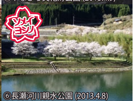
⑥ 長瀬河川親水公園 (2013.4.8)