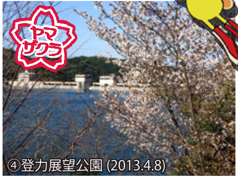
④ 登力展望公園 (2013.4.8)