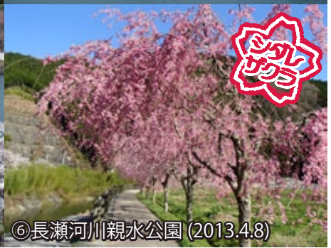
⑥ 長瀬河川親水公園 (2013.4.8)