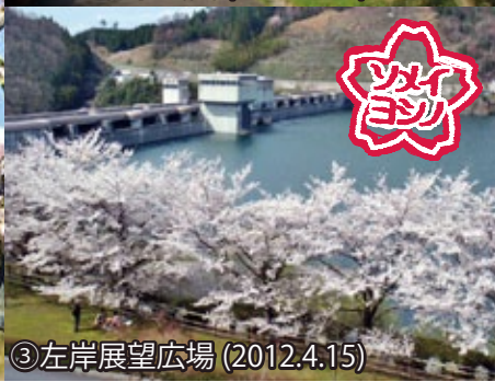
③ 左岸展望広場 (2012.4.15)