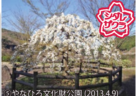
⑤ やなひろ文化財公園 (2013.4.9)