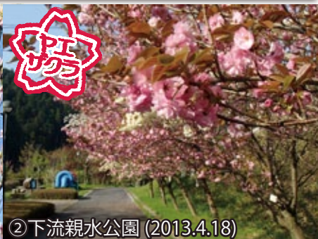
② 下流親水公園 (2013.4.18)