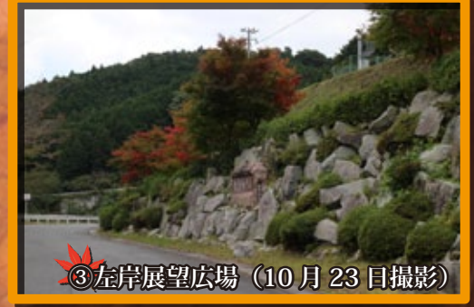
③左岸展望広場 (10月23日撮影)