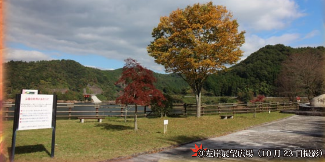
③左岸展望広場 (10月23日撮影)