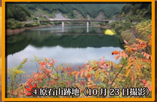
④原石山跡地 (10月23日撮影)