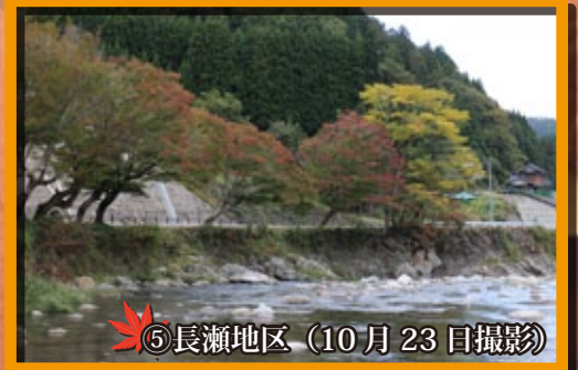
⑤長瀬地区 (10月23日撮影)