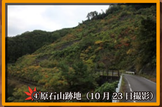
④原石山跡地 (10月23日撮影)