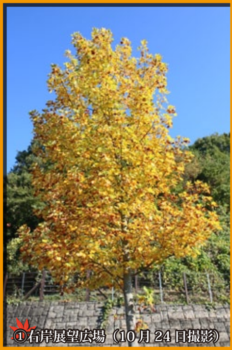
①右岸展望広場 (10月24日撮影)