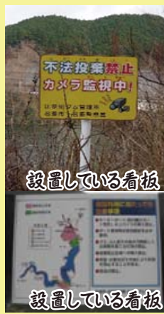
設置している看板