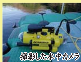
撮影した水中カメラ