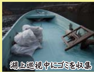
湖上巡視中にゴミを収集