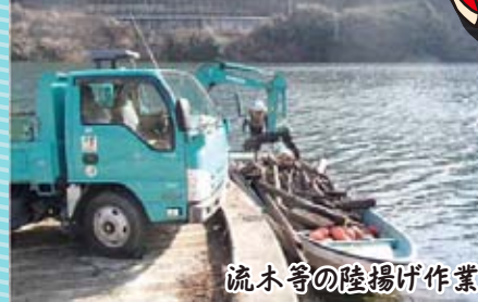
流木等の陸揚げ作業