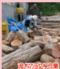
流木の玉切り作業

比奈知ダムでは、収集した流木を玉切りし、希望者に配布する予定です。後日改めてお知らせします。