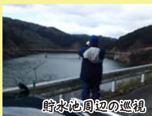
貯水池周辺の巡視

比奈知ダムでは、貯水池周辺に不法投棄禁止を呼びかける看板と監視カメラを設置しています。また、貯水池周辺の巡視及び、作業船での湖上巡視も定期的実施。周辺環境に目を配っています。