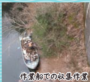
作業船での収集作業

収集した物は分別を行います。流木などは玉切りし、薪として再資源化することで、環境維持に貢献しています。