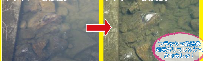
フラッシュ放流後