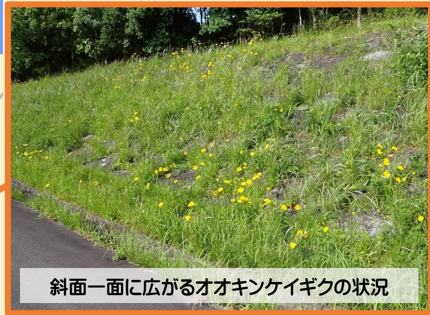
斜面一面に広がるオオキンケイギクの状況

オオキンケイギクは外来生物法（正式には「特定外来生物による生態系等に係る被害の防止に関する法律」）により、栽培、運搬、販売、野外に放つことなどを禁止されています。