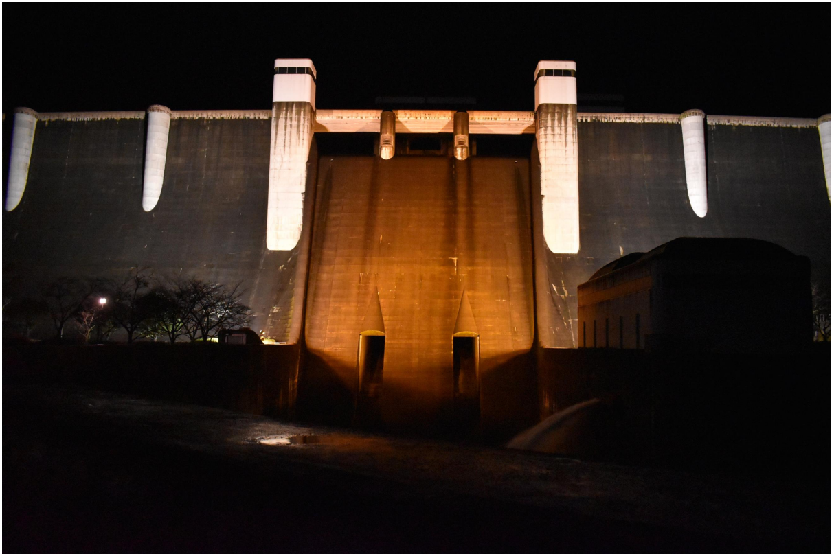
下流からダムを望む