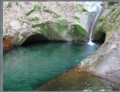
↓龍鎮神社と↑龍鎮渓谷