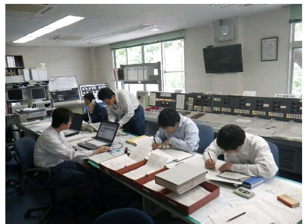
過去の訓練状況 (平成24年度) (室生ダム管理所 操作室)