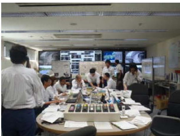
過去の訓練状況 (平成24年度) (木津川ダム総合管理所 情報管理室)