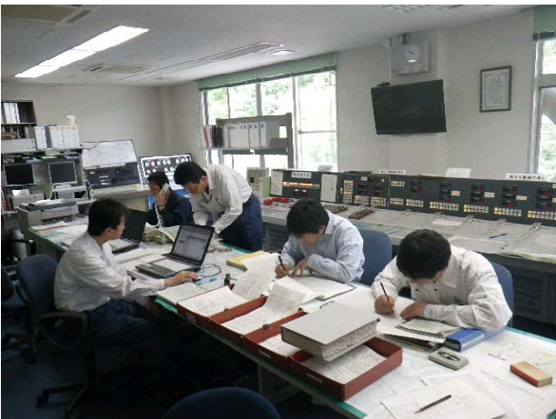
室生ダム管理所 操作室