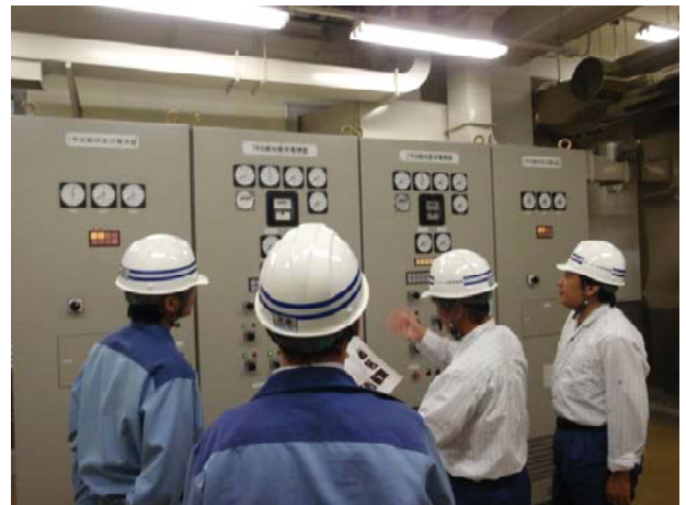
比奈知ダム 予備発電運転訓練状況