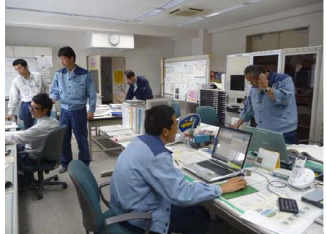
青蓮寺ダム管理所 操作室