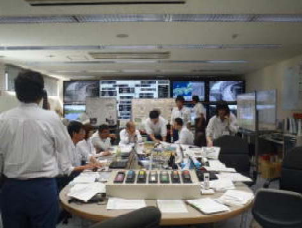
木津川ダム総合管理所 情報管理室