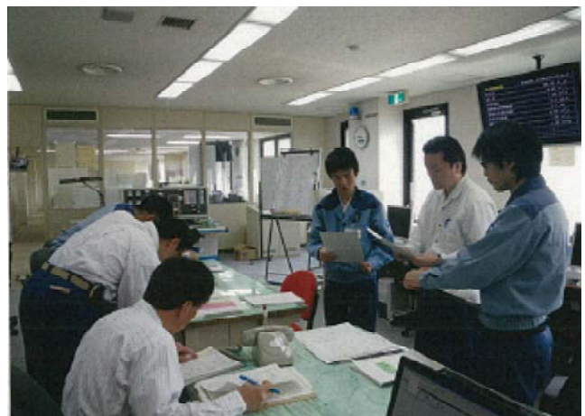
過去の訓練状況 (平成24年度) (布目ダム管理所 操作室)