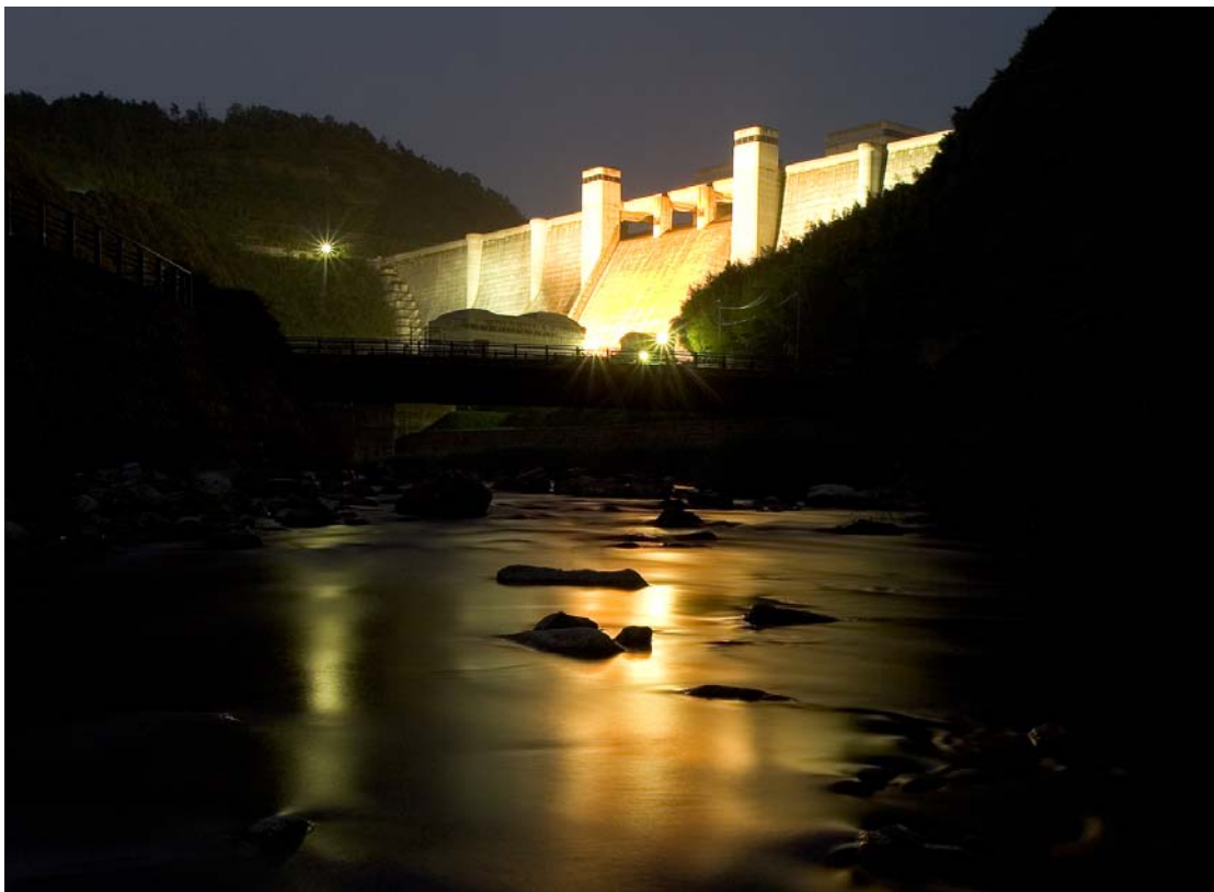
ダム下流の親水公園から望む