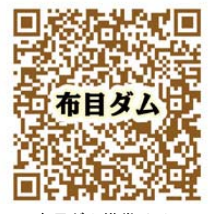
布目ダム 布目ダム携帯サイト