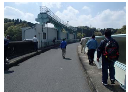
(参考) 昨年の点検実施状況