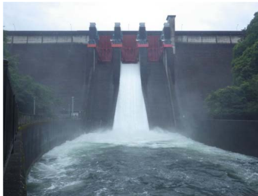
洪水放流設備（洪水吐きゲート）からの放流の状況