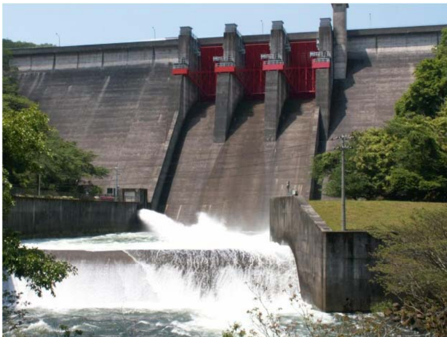
利水放流設備（バルブ）による放流（約 13\text{m}^3/\text{s} ）の状況