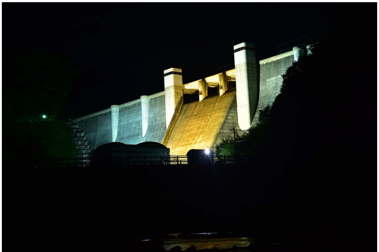
ダム下流から望む