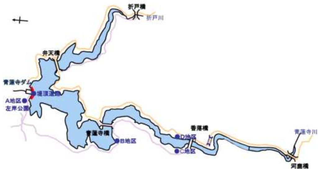
青蓮寺ダム貯水池平面図