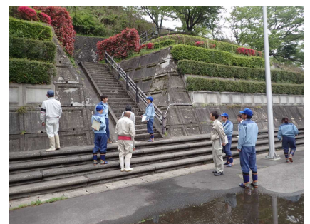
(参考) 昨年の点検実施状況