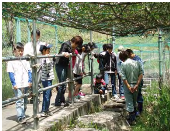
オオサンショウウオの観察