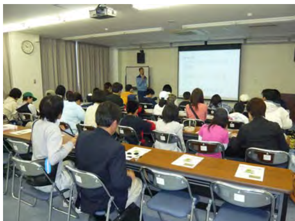
ふれあいホールでの説明風景

今回の環境勉強会は、参加された皆様にとって、自然の大切さを学ぶ、良い機会となったのではないのでしょうか。今年、 生物多様性条約第10回締約国会議(COP10) が、10月に愛知県で開催されます。COPとは、多様な生物や生息環境を保護し、その恵みを将来に渡って利用することを謳った国際条約ですが、COP10は、その条約締約国による第10回目の会議です。このようなイベントに先立ち、環境学習会に参加された皆様の環境に対する関心や熱意に触れ、私達も改めてしっかりと環境保全に取り組んでいこうと決意いたしました。 【環境課 鷲尾盛士】