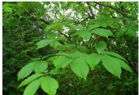
コシアブラ (ウコギ科)