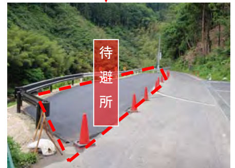
待避所1の施工状況