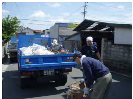
搬出される大量のゴミ