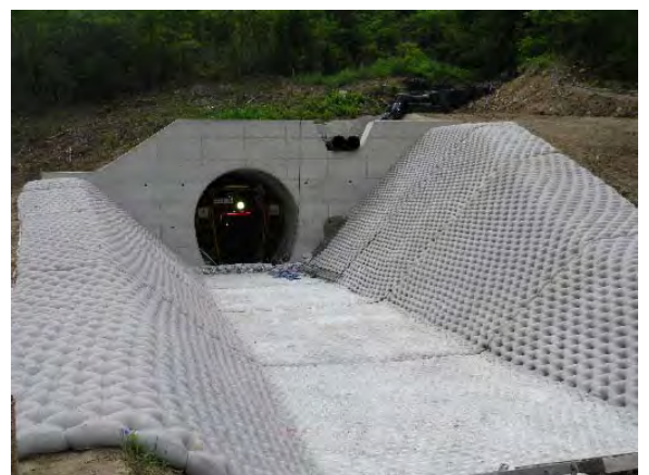
トンネル吐口部の様子