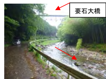
6月19日 10:40 流量約 1.5m 3 /秒