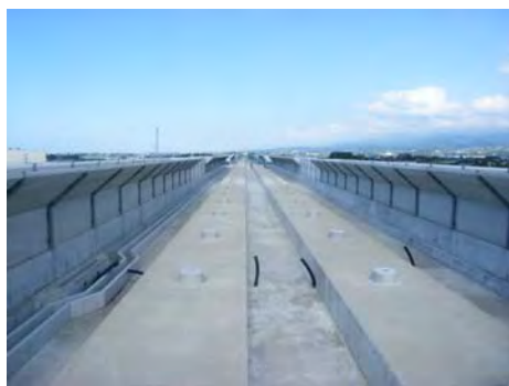
北陸新幹線高架橋上(富山市内)

本工事におきましては、県道青山美杉線の早期開通を目指し、無事故無災害で予定工期内に工事を完成するように関係者全員が一丸となって工事を行います。