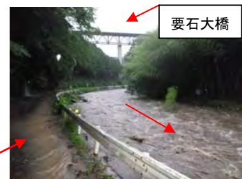
6月19日 18:46 流量約 100.0m 3 /秒