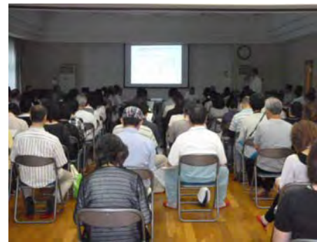
説明会の様子 【第一用地課 安田直人】