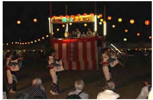
盆踊りで賑わう桐ヶ丘夏祭り

ブースには、年齢を問わず多くの方々が訪れ、一生懸命クイズにチャレンジしていました。