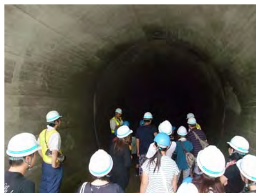
仮排水トンネルを探索中♪

初めて見た。目や前足がかわいかった。」といった感想が寄せられました。また、夏休みの絵日記に、今回の見学会のことを書いてくれた子供たちがいると聞き、地域の未来を担う子供たちに、川上ダム建設事業について楽しく学んでもらう機会を提供できたと感じました。