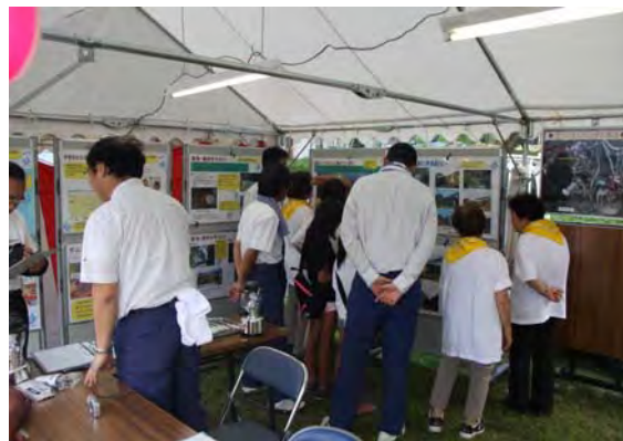
クイズにチャレンジ中!

クイズの最中、「ダムはいつできるのか?」、「付替道路はいつ全線開通するのか?」、「ダムができて桐ヶ丘団地は安全なのか?」といった質問が寄せられ、職員が一人ずつ丁寧に回答する場面も見られました。