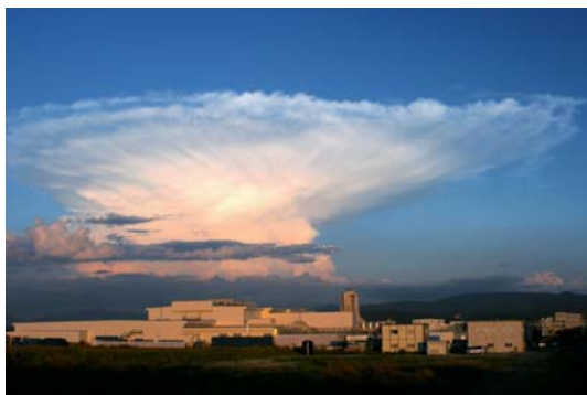
発達した積乱雲の外観

今年の夏は、高知県で日本全国の史上最高である気温 41℃を記録するなど、厳しい暑さに見舞われましたが、その一方では、7月28日の山口県・島根県での大雨をはじめ、日本各地の至るところで局地的かつ短時間での強い雨が観測されており、相次いで被害が発生しています。