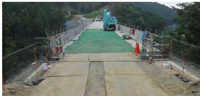
A1橋台側より種生方面を望む