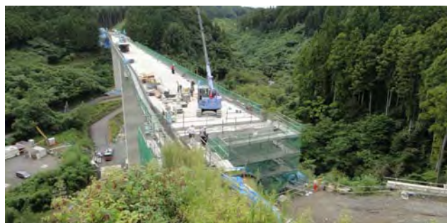
A2橋台側より青山羽根方面を望む