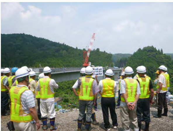
貯水池横断橋工事を見学される霧生区の方々

両会では、当建設所職員が日頃の事業へのご理解に対して感謝を述べた後、川上ダム建設事業の概要や進捗状況、現在進めている付替県道青山美杉線の工事の進捗状況などについて説明しました。