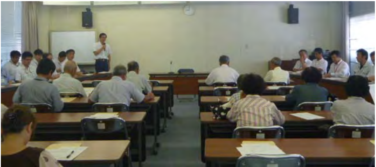
川上区の事業説明会の様子

川上ダム建設事業の実施に伴って集団移転頂いた川上区の方々に対する事業説明会を7月25日(木)に、また、霧生区の方々に対する現場見学会を7月27日(土)に開催しました。