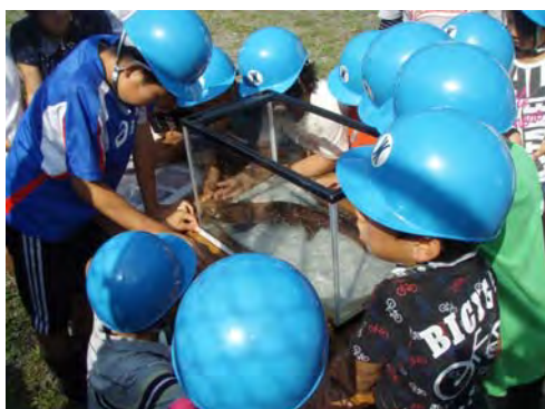
オオサンショウウオを間近で観察♪

子供たちからは、「すごく長いトンネルで、こんな所に行けたことがなかったから良い経験になった。」や、「オオサンショウウオを