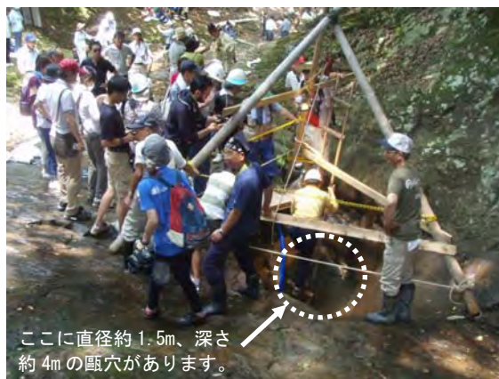
ここに直径約1.5m、深さ約4mの甌穴があります。