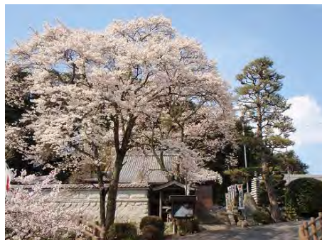
常楽寺の桜（伊賀市種生） 平成26年4月9日撮影