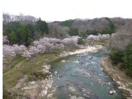
岩倉峡の桜 平成26年4月4日撮影