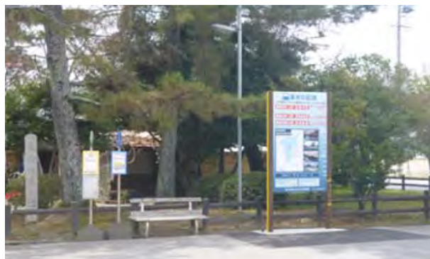
浸水標示板と鍵屋の辻史跡公園

新しくなった浸水標示板をご覧くださいととともに、洪水への備えを確認されてはいかがでしょうか。