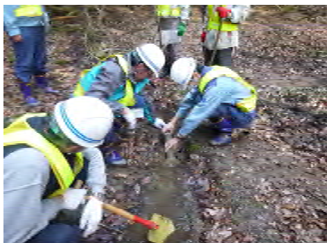
湧水調査の実施状況

当建設所では、これまでにこの尾根において地質や地下水位の調査を実施しており、その結果、この場所はダムサイトと同様に強固な岩盤の上、現状の地下水位が常に貯水池の最高水面よりも高い位置にある事を確認しているところです。