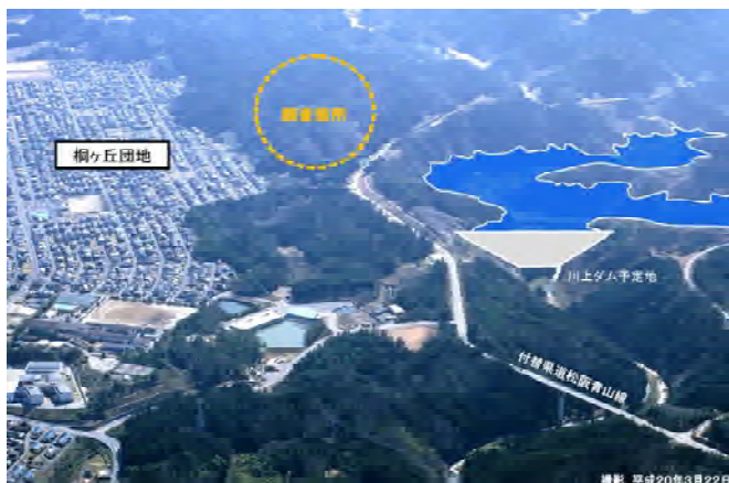
湧水調査を実施した尾根

当日は、桐ヶ丘自治会の皆様と県道脇から尾根に入り、約30分かけて山道を登って観測ポイントへ向かいました。観測ポイントでは、メスシリンダーを用いて湧水量を観測し、平年並みの湧水量であることを確認しました。