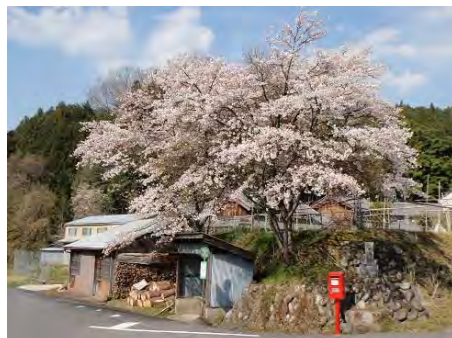
矢地バス停付近の桜（伊賀市種生） 平成26年4月9日撮影