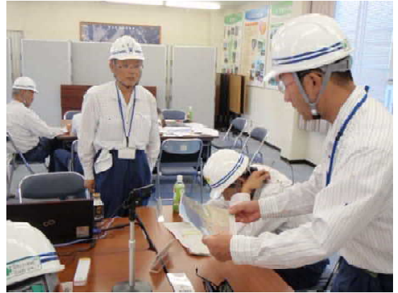
防災本部長から下の巡視指示

今回は、通勤時間帯に大規模地震が発生して、庁舎が被災し、電気等のライフラインが断絶されたという想定で訓練を行いました。訓練では、防災本部を設営するための発動発電機を利用した電源確保や通信機器の設置、被災状況を把握するための巡視や無線機器を利用した情報伝達等を行い、地震発生後に実施すべき作業や手順を確認しました。