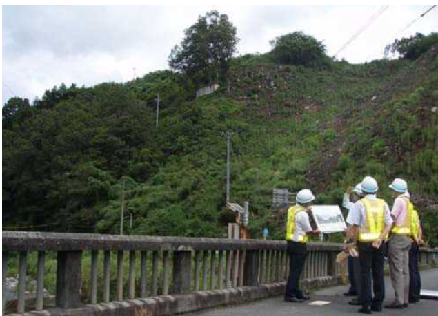
西之澤橋からの視察(三重県地域連携部長)

付替県道青山美杉線の平成29年度全線供用に向けて工事を進めるとともに、一日も早い川上ダムの完成を目指し、国土交通省、三重県をはじめとする関係機関との連携を密にして事業を進めてまいります。