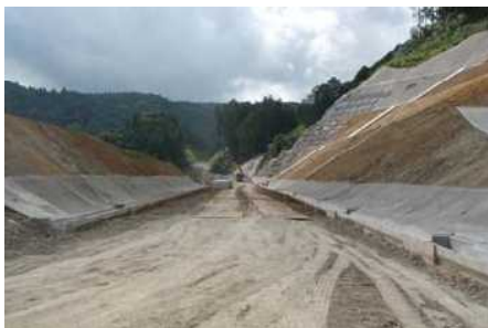
土を切り取って道路を作る区間

日々変わっていく工事現場ですが、平成29年3月の完成に向け、順調に工事は進んでおります。