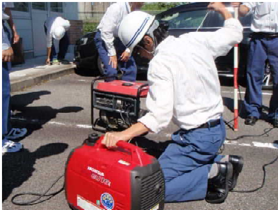
発動発電機の始動訓練

また、9月号でご紹介したとおり、当建設所は今年の6月から防災業務に係る地域との連携を進めるために、市町村等との連絡窓口「地域防災連携窓口」を設置しております。今回の訓練では、地元自治体から地震被害に伴う物資提供依頼を受けたことを想定して、必要物資の積み込みや運搬訓練を行いました。