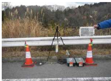
騒音・振動調査 器具設置イメージ