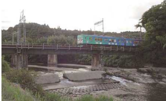
木津川を渡る電車