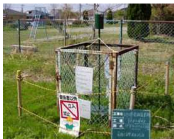
降下ばいじん量調査 器具設置イメージ

調査実施に伴う交通規制等はありませんが、周辺住民の皆様におかれましては、ご理解、ご協力のほどよろしくお願いします。