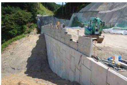
土を盛り上げて道路を作る区間