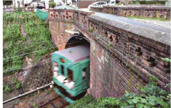
赤れんが橋をくぐる電車を激写！