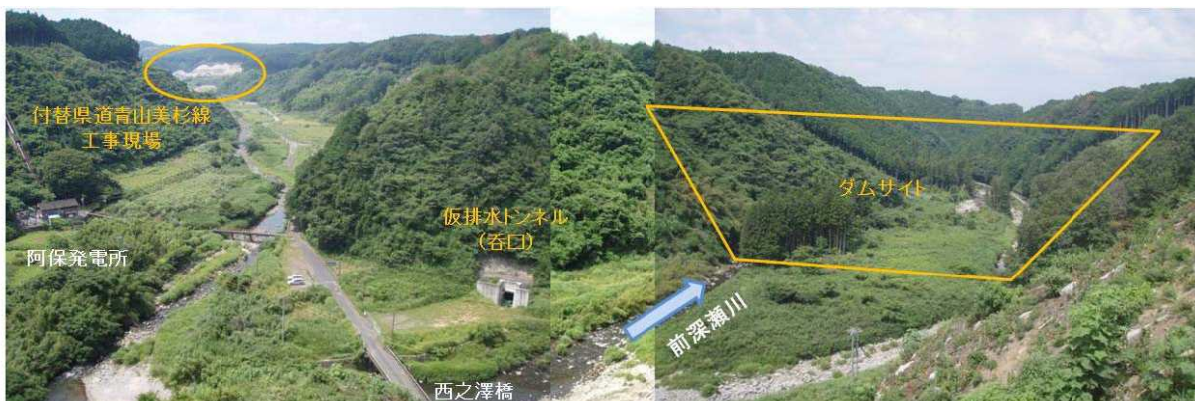
ダムサイト右岸から見た川上ダム事業地内