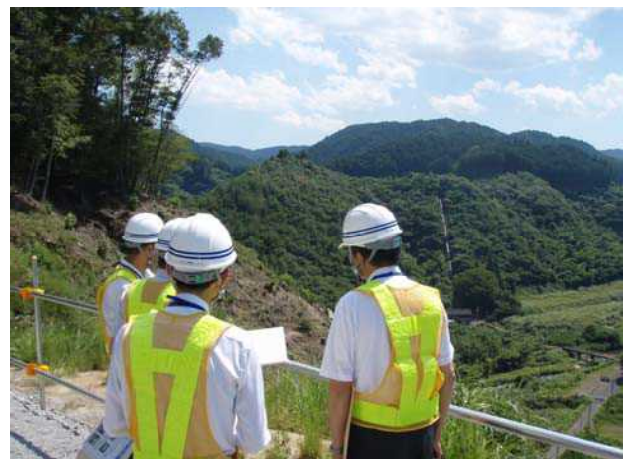
ダムサイト右岸からの視察(近畿地方整備局河川部長)