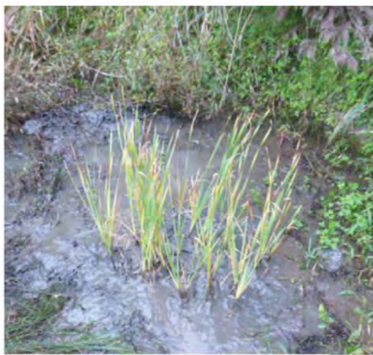
移植時のコガマの状況 (H26.10撮影)

また、忘れてはならないのが地権者の方の協力があって移植ができているということです。地権者の方にはこの取組みを丁寧に説明し、土地の使用を許可して頂きました。地権者の方に深く感謝しつつ、今後もコガマの成長を見守っていきます。