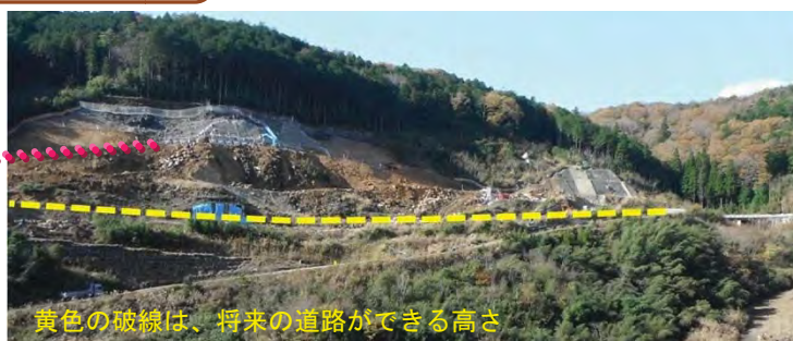
黄色の破線は、将来の道路ができる高さ