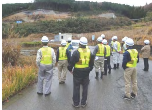
付替県道工事の進捗状況を確認されるみなさん

当建設所といたしましては平成29年度の付替県道青山美杉線の一日も早い通行開始に向け、現在進めている区間の工事を安全かつ確実に実施していきます。それまでの間、ご不便をおかけいたしますが、ご理解のほどよろしくお願い申し上げます。