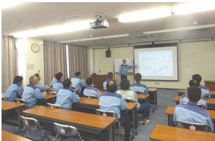
熱心に講義を受ける職員