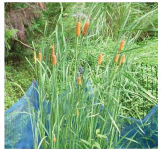
移植後のコガマの状況 (H27.8撮影)