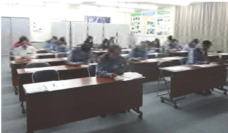
ストレスチェック実施中

※セロトニン式呼吸法：精神をリラックスさせる精神伝達物質（セロトニン）を意識的に増やす呼吸法