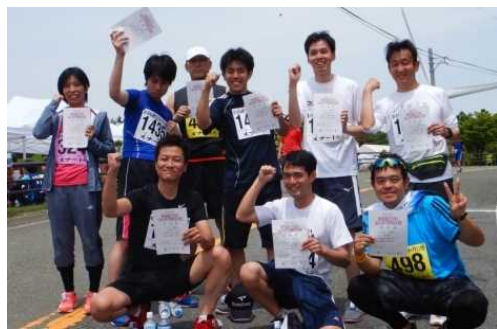
チーム川上ダム全員完走!

大会関係者の皆様をはじめ、地域の皆様には、ランナーにとって良い環境を作っていただき感謝いたします。青山高原は、春はアセビ・ツツジの群生が咲乱れ、続いてナデシコが赤い小さな花を見せ、秋はススキの白い穂をなびかせ冬の樹氷も美しく、四季折々楽しめるスポットです。読者の皆様におかれましても、一度訪れてみてはいかがでしょうか。