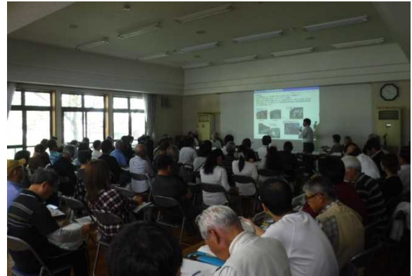
事業説明の様子～桐ヶ丘アミティ～

地下水については、現在の地下水位は、ダム完成後の最高水位より常に高いことから、貯水池の水が桐ヶ丘団地側に流れ込むことはないと考えられると説明しました。（詳しくは2018年5月号参照）