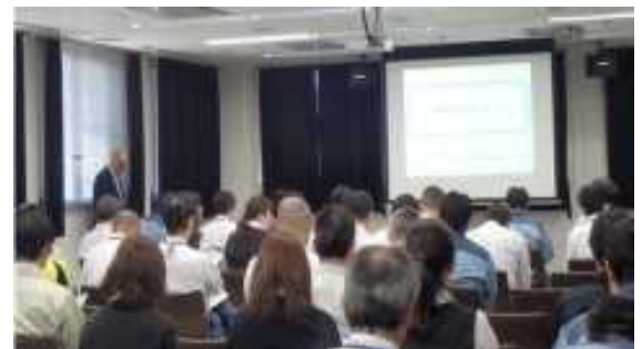
説明会の様子(木津川ダム総合管理所)