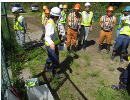
保護施設にて オオサンショウウオの観察を行う

現地学習では、オオサンショウウオの保護施設の見学を行いました。この日、保護施設にはオオサンショウウオが一時的に保護されており、オオサンショウウオの姿や、咬みつく力がとても強く危険だという説明に驚きの声が上がりました。また、事業地内で保護している貴重な植物へも、その詳細や保護方法に関する質問などがあがり、積極的に意見交換が行われる充実した環境学習会となりました。