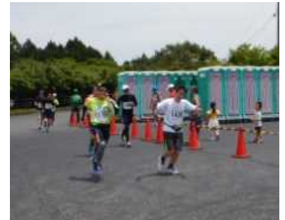
ゴール前の勇姿(右が編集長)

我らが「チーム川上ダム」も編集長をはじめ9名で参戦、日頃のトレーニングの成果を発揮し(?)、沿道からの温かい声援にも後押しされ、全員が無事に完走を果たしました! なかにはクォーター部門において50分を切る好タイムを叩き出した職員もあり、その場で新マラソン部長に就任が決まりました!