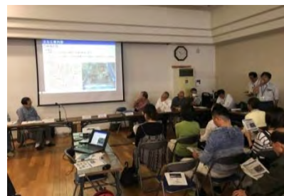
説明会のようす（桐ヶ丘自治会）

桐ヶ丘自治会からは、管理後の右岸鞍部の調査継続や、「WELCOME 川上ダム観眺台 みてちょうだい 」の休日開放に関するご要望をいただきました。