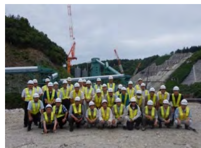
タワークレーンをバックに記念撮影（青山住民自治協議会）

説明会後は、「川上ダム観眺台 みてちょうだい 」や、ダムサイトにそびえ立つタワークレーンの間近より工事現場をご覧いただきました。続いて川上区の皆さまがかつてお住まいになっておられた上川原方面へ移動すると、様変わりした景色の一方で当時の暮らしに思いを馳せながら見学される姿が印象的でした。