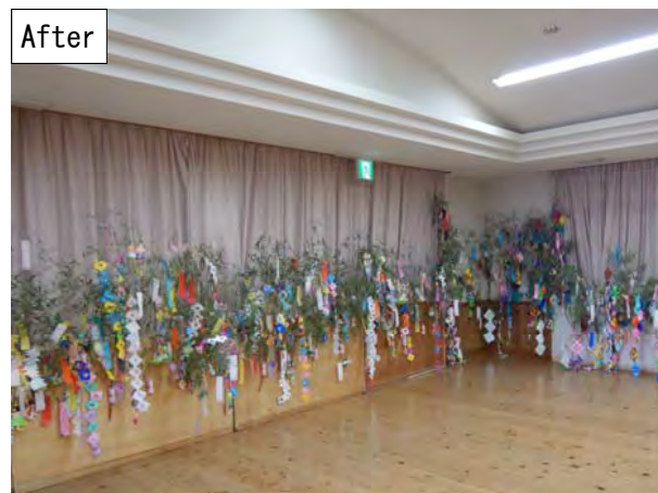
願い事が叶いますように！