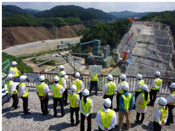
真剣に聞き入る採用予定者の皆さん

6月13日（木）、水資源機構の令和2年度新規採用予定者への施設見学会を開催しました。この見学会は、採用前に当機構の現場を知っていただくために、筆記試験の合格者に対して実施しているもので、土木職、事務職、機械職合わせて15名の参加がありました。