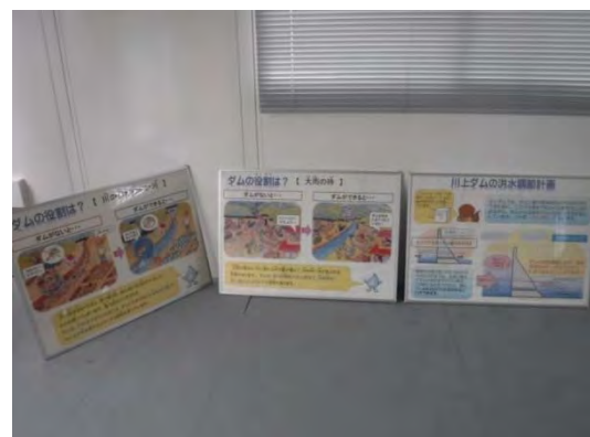
川上ダムのことを知ってください!