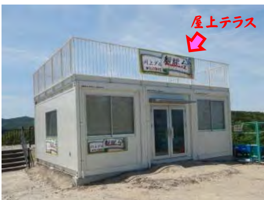
情報館オープン! (屋上テラスもあります)