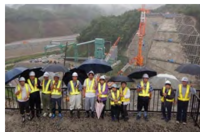
「川上ダム観眺台 みてちょうだい 」にて記念撮影（川上区）

この秋にはよいよ事業最盛期に突入しますが、皆さま方のお気持ちを決して忘れずに、地域と協力しながら皆さまに喜んでいただけるようなダム造りに努めてまいります。また、いただいたご意見を踏まえ、今後も安全で確実な事業の進捗に努めてまいりますので、引き続きご理解とご協力のほど、よろしくお願いいたします。