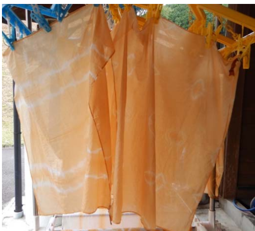
ハンカチの植物染め

川上ダムでは、他団体が主催するツアーの受け入れ経験が少なく、手探りでの対応となりましたが、実施してみれば大盛況となりました。これからも川上ダムを地域の魅力の一つとして発信していただけるよう、地域に根ざしたダム建設工事を進めてまいります。