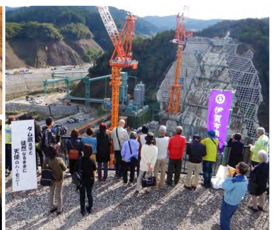
川上ダム建設現場見学の様子 (観眺台) みてちょーだい