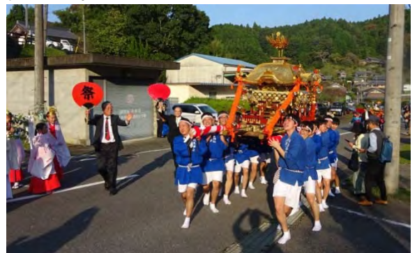
わっしょい！わっしょい！