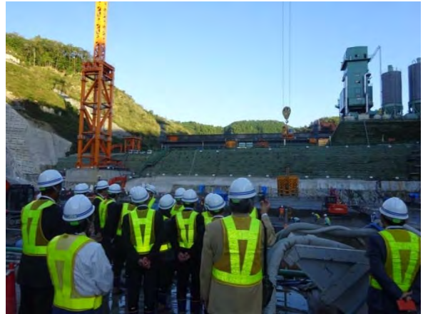
下流からダム現場を一望