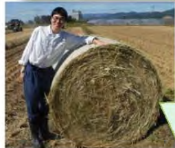
ワラロールと記念撮影♪