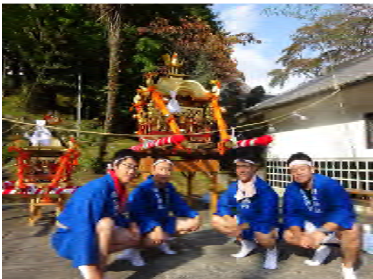
戦(祭り)に向かう戦士たち