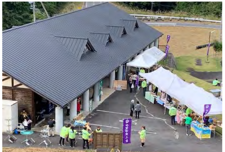
青山ハーモニーフォレストでの物産品販売

参加者からは「タワークレーンの大きさにびっくりした」「ダムができると聞いていたが、建設現場にきてみると迫力が違う」「ダムの役割が理解できてよかった」等の声をいただきました。