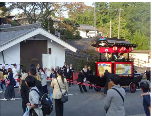
山間部では珍しい舟形だんじり