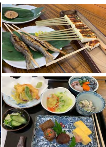
地元の手作り昼食