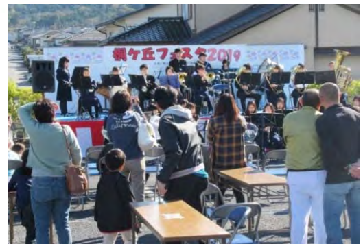
青山中学校吹奏楽部の演奏で開幕！

ステージでは青山中学校吹奏楽部による演奏や、よさこいソーランなど様々な催しが行われ、大盛り上がりとなっていました。また、会場内では、新鮮野菜やパン、農産加工品など、地元で作られた様々なものが販売されており、筆者も川上ダムブースでの案内の合間に堪能させていただきました。