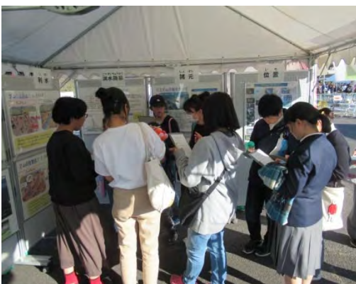
みんなでクイズに挑戦中

川上ダムブースでは、川上ダムについて地域の皆さまに理解を深めていただくために、パネル展示をはじめとするご案内をしました。また、クイズに参加していただいたり、ヘッドマウントディスプレイでダム工事のVR体験をしてもらうなど、例年以上に地域の皆さまにより親しみを持っていただけるような内容を準備しました。ご来場いただいた方からは「完成するのが楽しみです」「川上ダムの役割を知ることができて良かった」などの感想をいただき、参加した職員一同の励みとなりました。