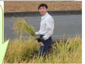
広大な田んぼで稲刈り

14日(月)から研修に参加し、稲刈りや野菜の収穫、稲の籾殻を取り除く作業などを手伝いました。力仕事が多かったですが、いままでやったことがないことが経験でき、とても新鮮な気持ちになりました。今回の研修にて、普段働いている中では知り得ない農業の利水の実態を知ることができ、とても勉強になりました。改めて水を利用する「利水」を意識しつつダム建設の業務に努めてまいります。