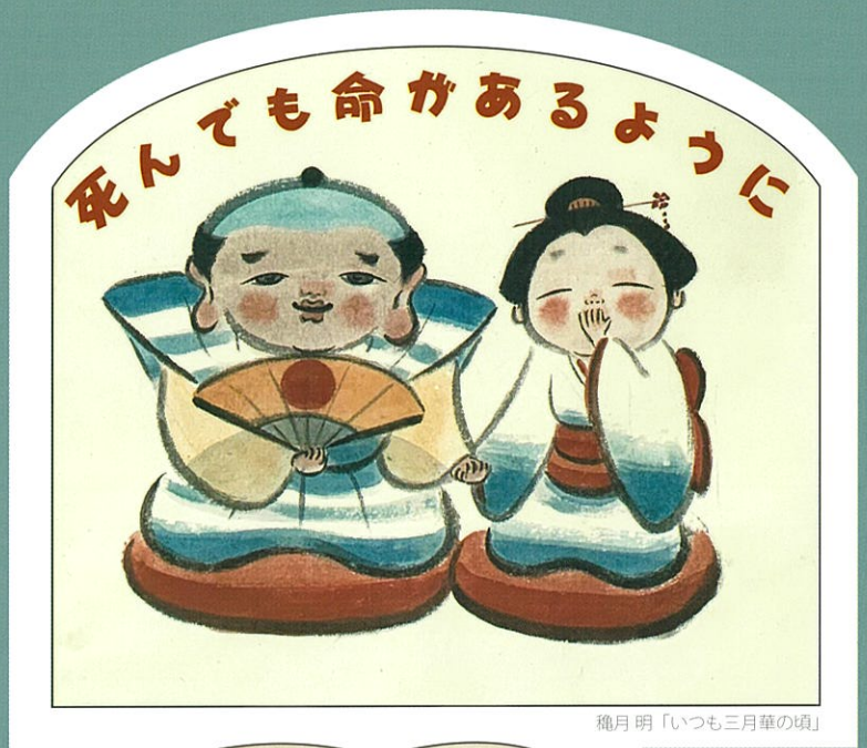
穂月明「いつも三月華の頃」

伊賀市ミュージアム青山讃頌舎 令和5年 夏の通常展 7月14日(金)～ 8月27日(日) 火曜休館