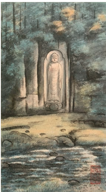
「流水磨崖仏」室生大野寺弥勒磨崖仏

近鉄青山町駅下車 徒歩 15 分、近鉄青山 町駅より R165 青山町駅前信号を直進、 西参道石段を大村神社へ * ご来館の方は大村神社を目指してお越 しください。